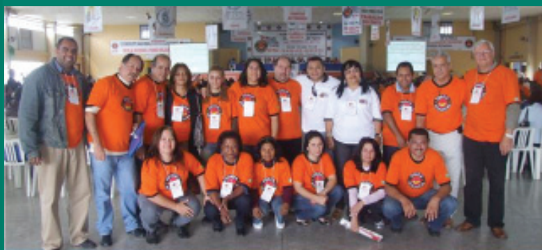
A nossa diretoria e representantes da CONACCOVEST estiveram presentes ao evento, em Piracicaba/SP

As principais discussões da plenária foram em torno das propostas para a melhoria dos trabalhadores e dos Sindicatos e, também, a nossa bandeira de luta é banir de vez o uso do amianto em nosso país (produto prejudicial para muitos companheiros e companheiras). Todas estas questões, no entanto, só podem ser deliberadas no Congresso.