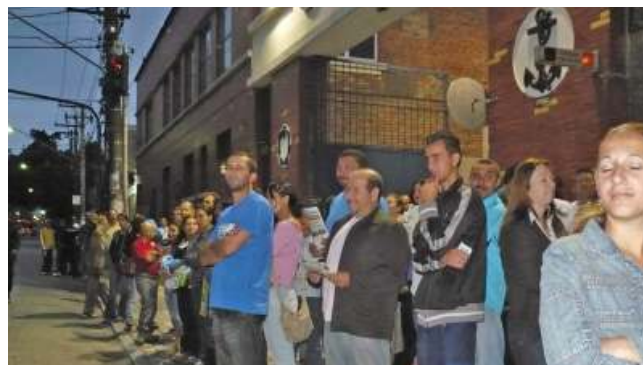
Paralisação na Coats Correntes começou na madrugada.