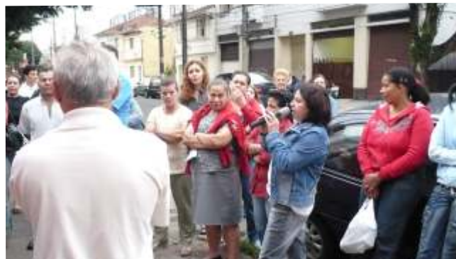
Na Malharia Marabá, funcionários cruzam os braços

Companheiros (as): Sigam somente as orientações dos sindicalistas do COMANDO UNIFICADO.