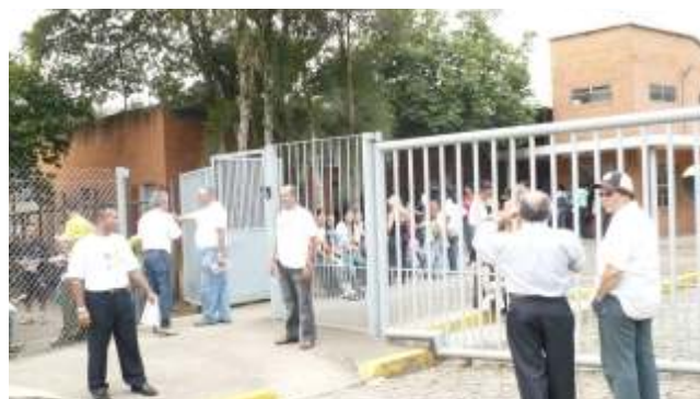
Paralisação da Paramount exige melhores salários

Por isso queremos uma solução urgente porque vamos continuar as nossas mobilizações nas portas das fábricas para conseguirmos o que é de direito.